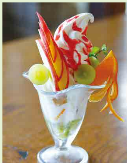
旬のフルーツ 1,080 (フルーツがその日で変わります)