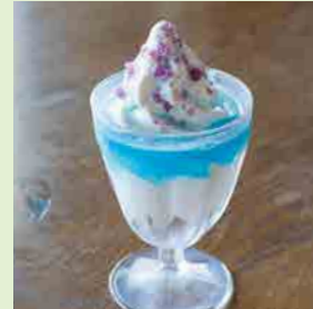
パチパチブルーハワイ