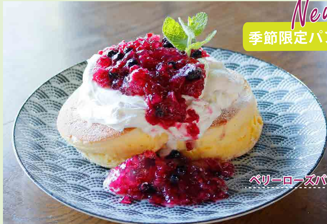
ベリーローズパンケーキ 1,280

仙生山の森で採れた バラのコンフィチュールに 甘酸っぱいベリーを加えた スペシャルパンケーキです