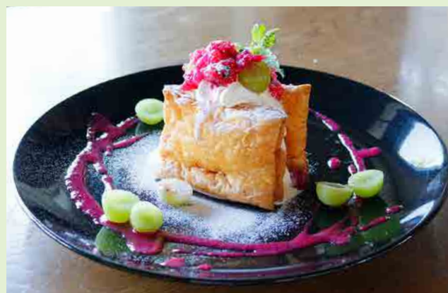
シャインマスカットとベリーローズ 1,080