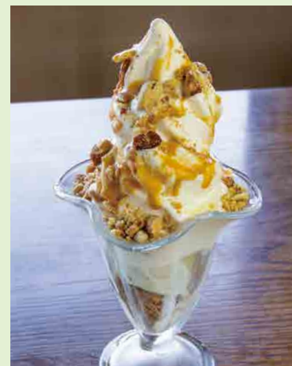
ピスタチオアイスとロカボナッツキャラメル 980