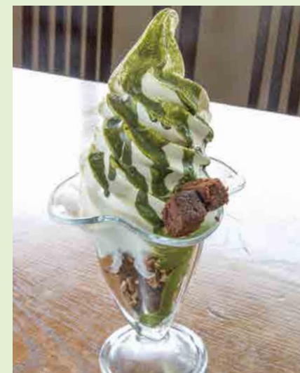
抹茶ガトーショコラ 980