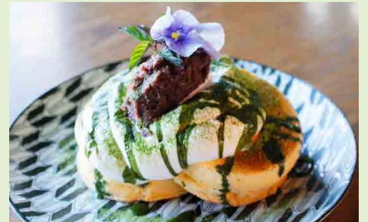
抹茶とあんこのパンケーキ 800