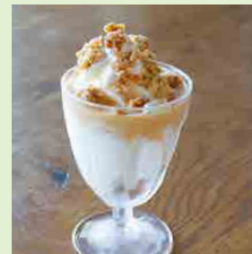
キャラメルグラノーラ