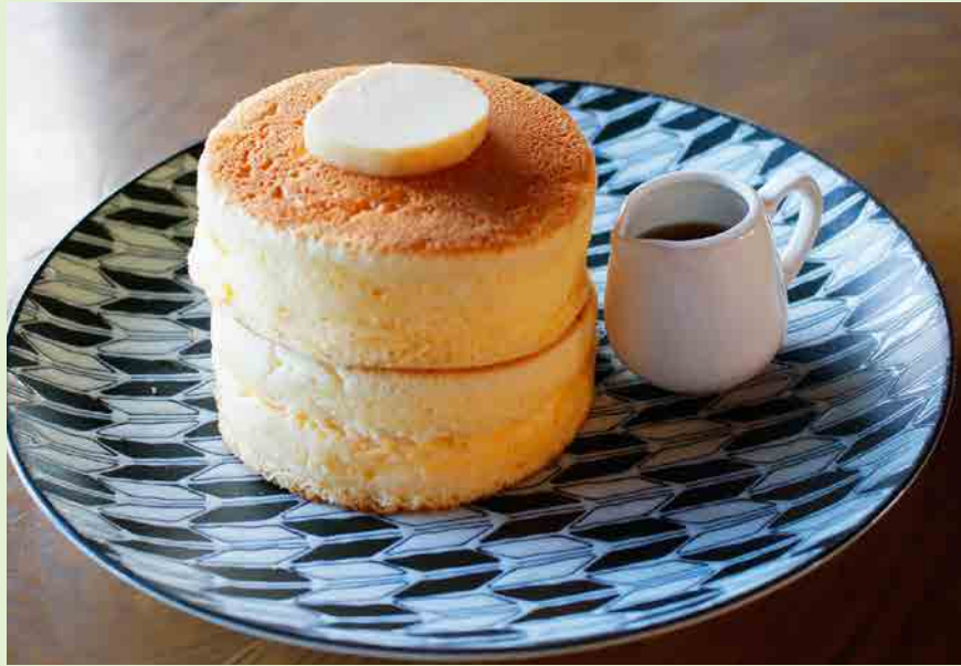
メイプルパンケーキ 780