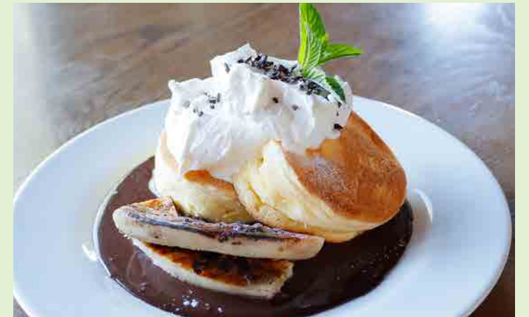
チョコレートバナナパンケーキ 1,180