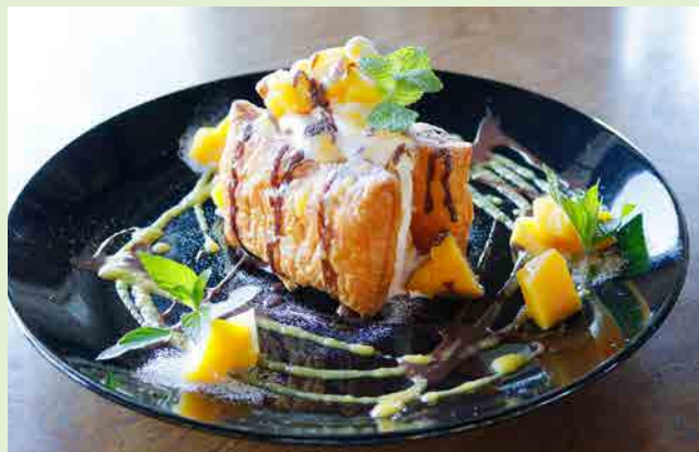
マンゴーチョコレート 980