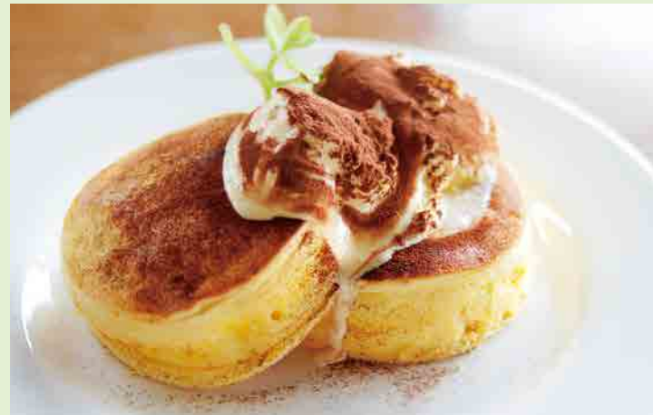
ティラミスパンケーキ 880