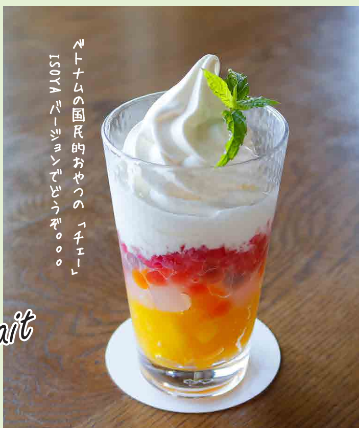
ベトナム風あんみつ・チュー 1,280