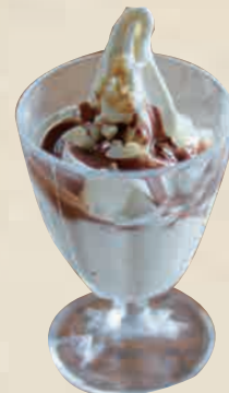
クラフトチョコナッツ