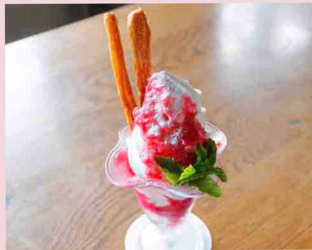
薔薇と苺のコンフィチュールパフェ 1,180