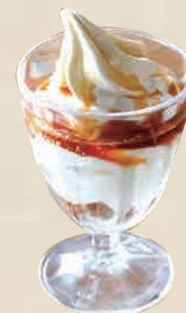
メープルコーヒー