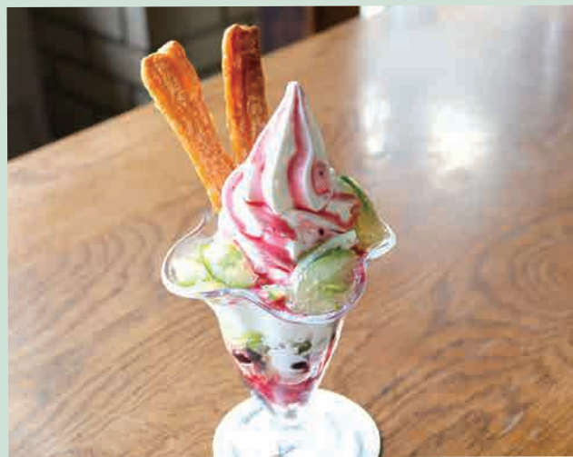
青レモンとベリーベリーパフェ 980