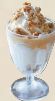
キャラメルグラノーラ