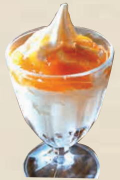
今川農園のみかんソース