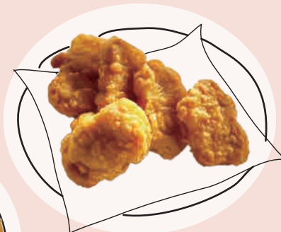
いそや 五十八チキンナゲット (5個) 500