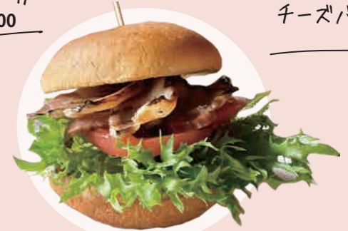
自家製バacon BLT 700