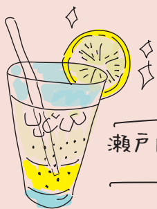
瀬戸内レモンゼリーソーダ 500