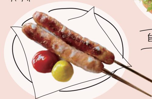
窯焼きチーズフランク (2本) 500