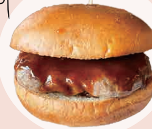
窯焼きパテバーガー 600