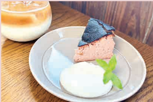
女峰(いちご)とホワイトチョコ

酸味と甘さのバランスの良い女峰を使用し、ホワイトチョコと合わせたチーズケーキです。