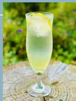
レモネードソーダ