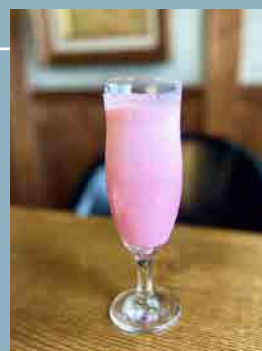
ピンクバナナジュース