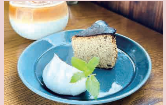
アールグレイとオレンジ 900