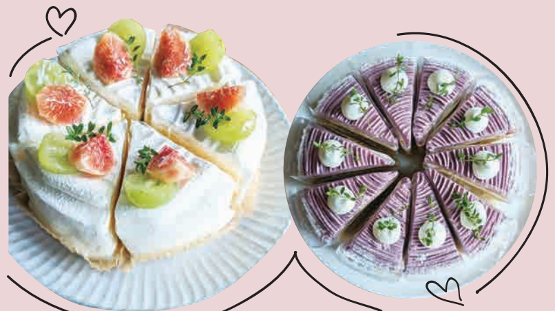
パティシエの気まぐれケーキ