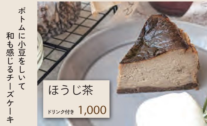
ほうじ茶 ドリンク付き 1,000