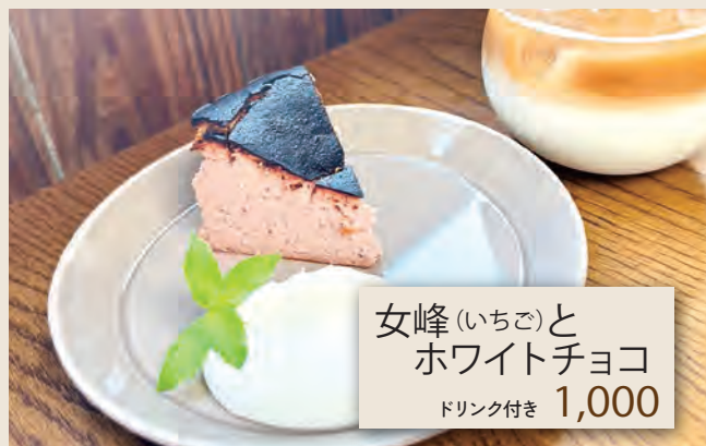
女峰(いちご)と ホワイトチョコ ドリンク付き 1,000