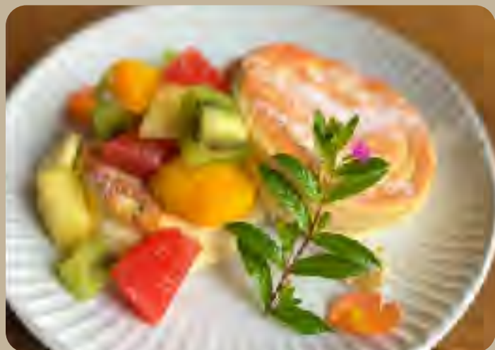
窯焼きフルーツパンケーキ 1,100