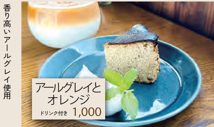
アールグレイと オレンジ ドリンク付き 1,000