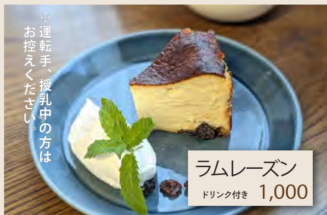
ラムレーズン ドリンク付き 1,000