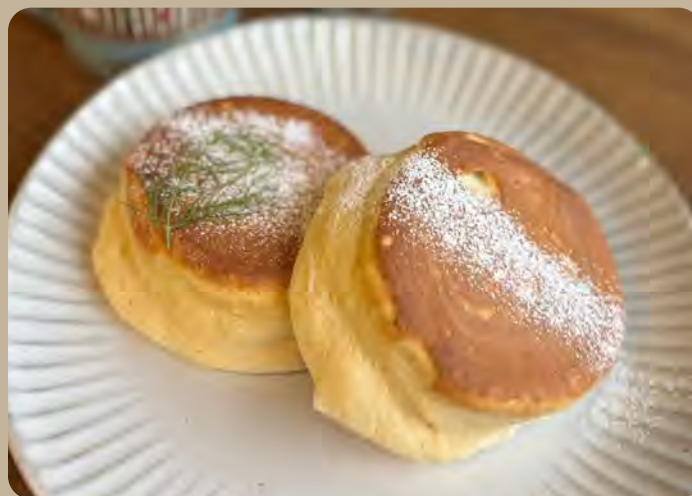
窯焼きパンケーキ 900