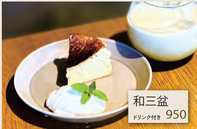
和三盆 ドリンク付き 950