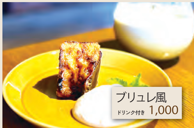
ブリュレ風 ドリンク付き 1,000