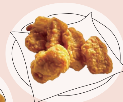
いそや 五十八チキンナゲット (5個) 500