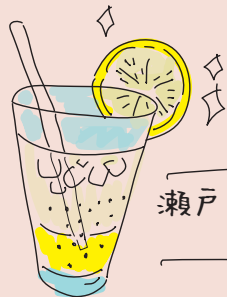
瀬戸内レモンゼリーソーダ 500