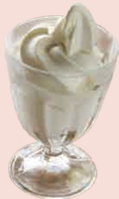
五十八プレミアム塩ソフト 570