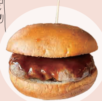
窯焼きパテバーガー 600