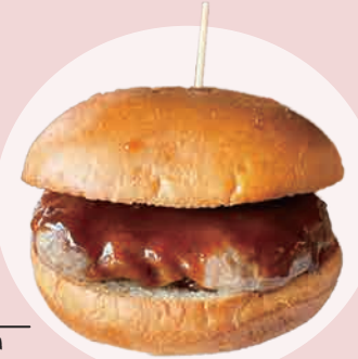
窯焼きパテバーガー 600