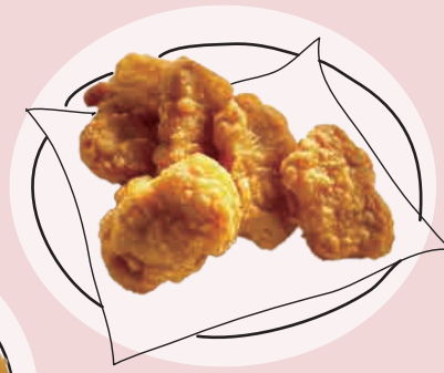
いそや 五十八チキンナゲット (5個) 500