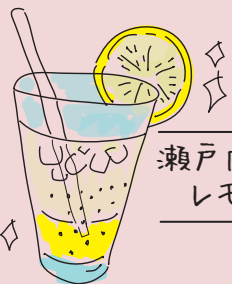
瀬戸内 レモンゼリーソーダ 500