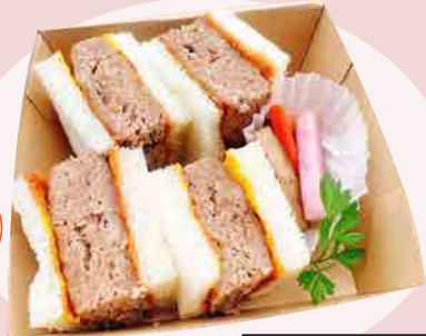
ハンバーグサンド 600