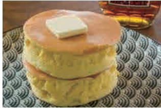
メープルシロップ 770