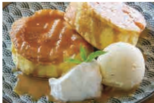
塩バターキャラメル バニラアイス添え 1,020