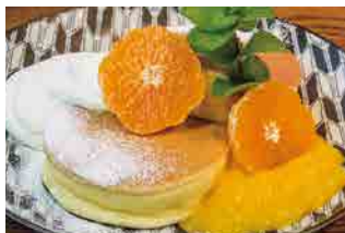
NEW 讃岐早生みかん 820