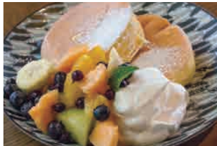
フレッシュフルーツミックス 1,130