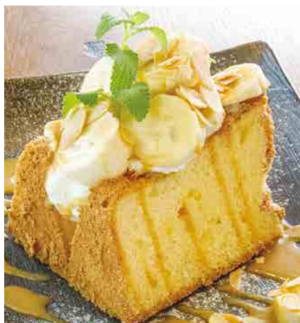
バナナキャラメル 700