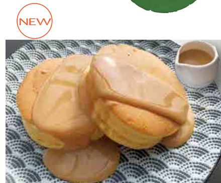
NEW 幸せのミルクパンケーキ 800