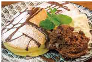
NEW Wチョコムース ホワイト & ブラック 970