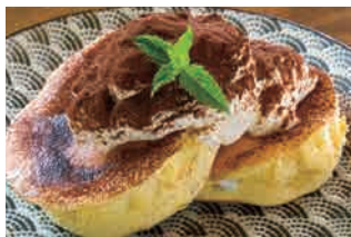
チーズクリーム ティラミス風 970