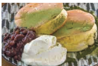
つぶあんと抹茶ソース 820