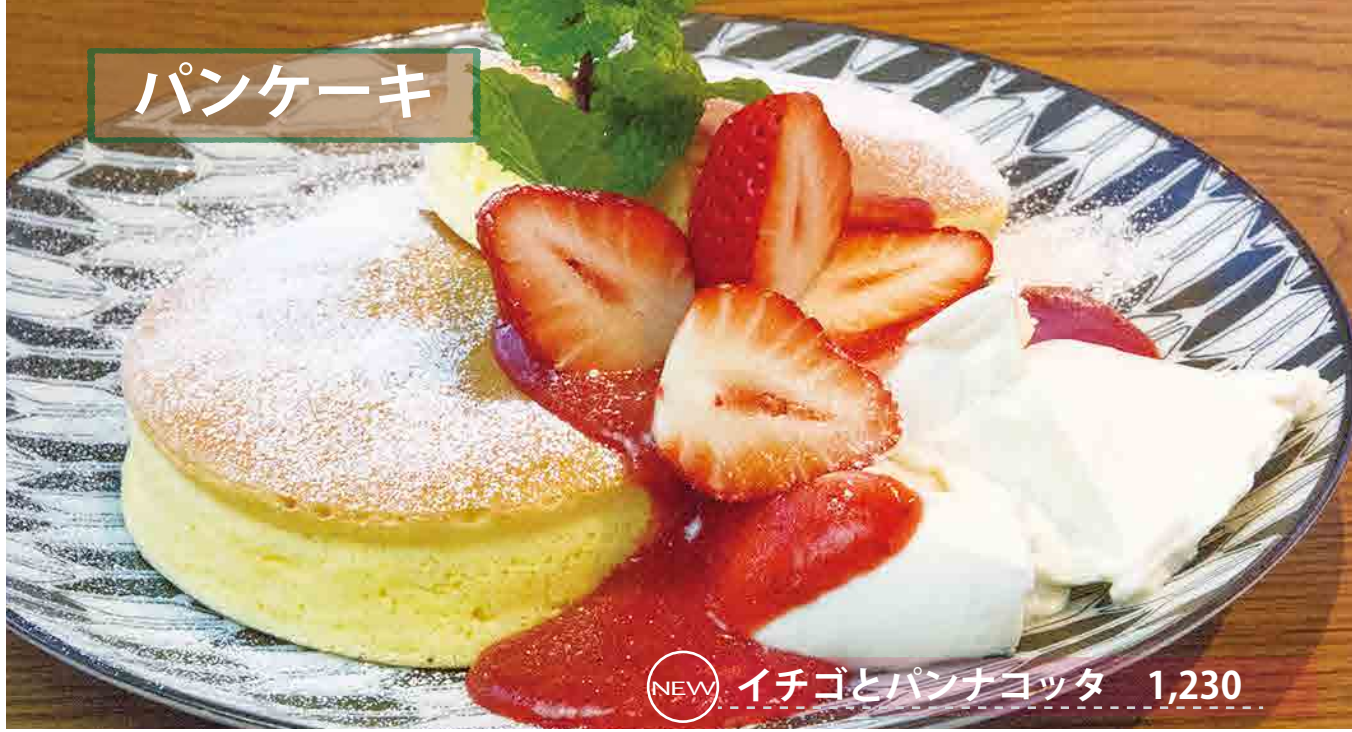
NEW イチゴとパンナコッタ 1,230