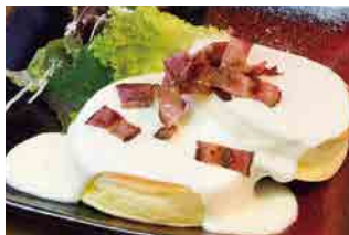
NEW ハニーベーコンチーズ 920