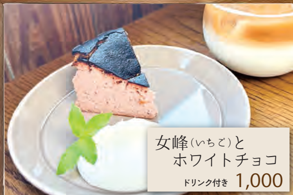
女峰(いちご)と ホワイトチョコ ドリンク付き 1,000