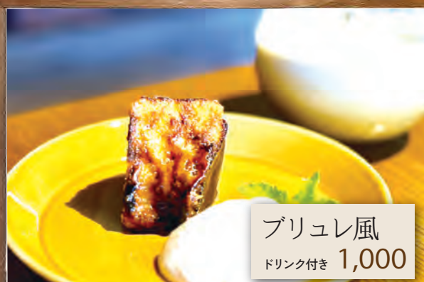
ブリュレ風 ドリンク付き 1,000