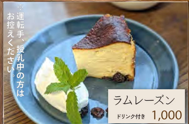
ラムレーズン ドリンク付き 1,000