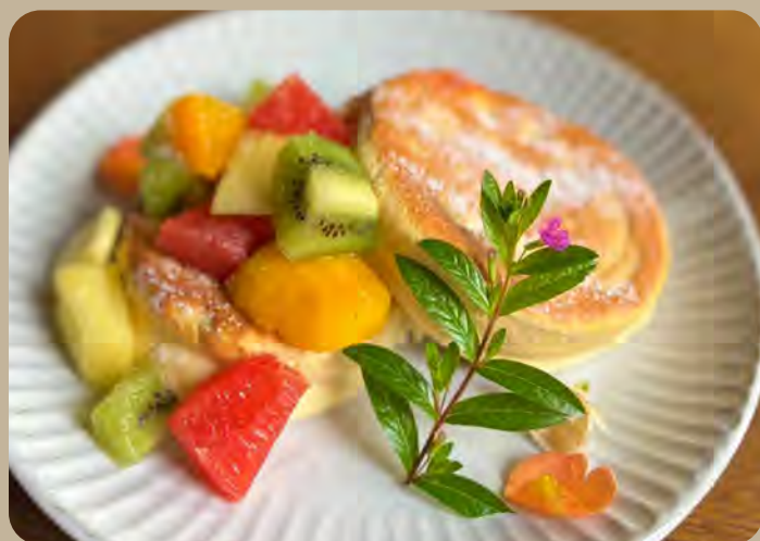
窯焼きフルーツパンケーキ 1,000