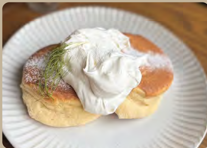
窯焼きパンケーキ + ホイップ 1,000