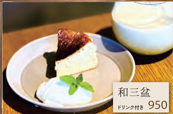
和三盆 ドリンク付き 950