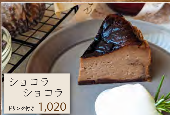
ショコラ ショコラ ドリンク付き 1,020