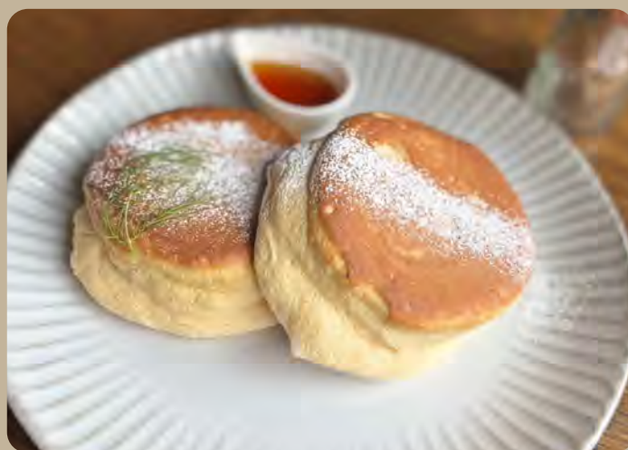
窯焼きパンケーキ + メープル 900