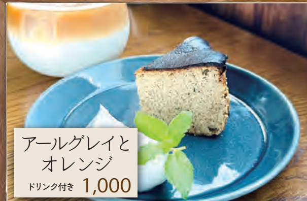
アールグレイと オレンジ ドリンク付き 1,000