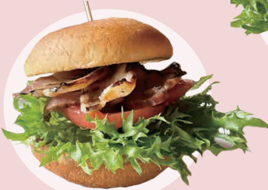
自家製ベーコンBLT(パテなし) 700