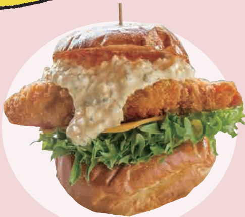
フィッシュタルタルバーガー 1,000