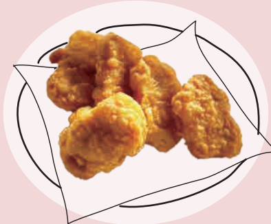
いそや 五十八チキンナゲット 5個 500 10個 900