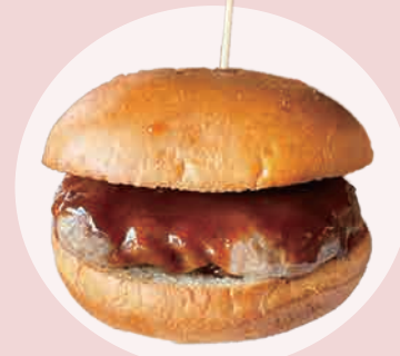
窯焼きパテバーガー 500