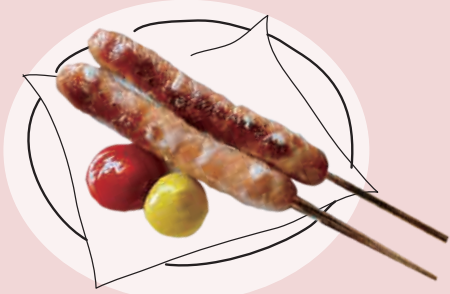
窯焼きチーズフランク (2本) 500