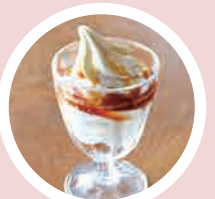
メープルコーヒー 500